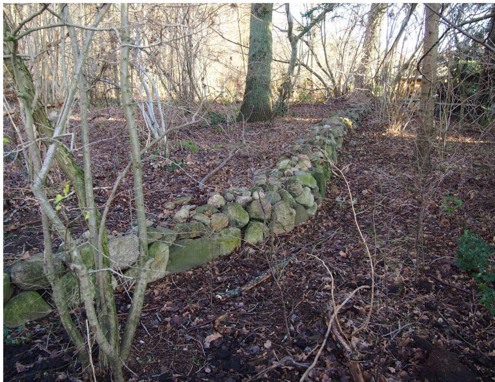
Fredskovforordningens stendige fra 1805. Ved yderkanten her fandtes der tidligere en grøft, som var med til at hindre kreaturer fra Stenstrup og Sauntes marker i at trænge ind i plantagen.

Her er også minder fra vor egen tid. På stranden ses resterne af tyskernes kystartilleri opstillet i 1940 til forsvar af indsejlingen til Øresund. Batteriet var