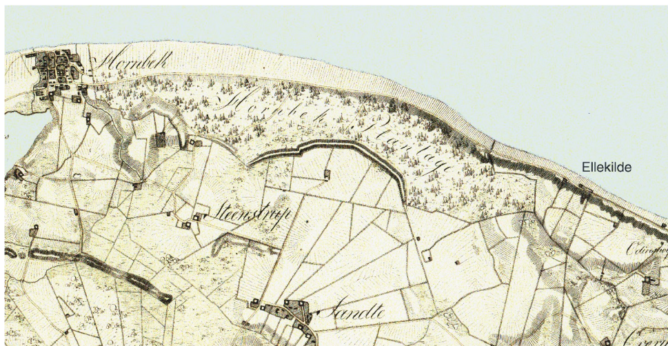
Kortet viser strækningen Ellekilde-Hornbæk 1824. Udsnit af Generalkvartermesterstabens kort opmålt i sommeren 1824. Det meget store sandflugtsdige ses i en bue nord for Stenstrup og Sautes jorde som afgrænsning af plantagen. Kort – og matrikelstyrelsen.

Men kampen mod sandet var begyndt allerede i begyndelsen af 1700-årene hvor man plantede marehalm og såede frø fra gran, fyr, pil, bøg og eg i den gamle Østerskov. Men det havde ikke stor virkning, da både kreaturer og vildtet gnavede løs, hvilket bevirkede, at der gang på gang gik hul på vegetationen, så sandlagene blev blottede og gav vinden frit spil til sandfygning.