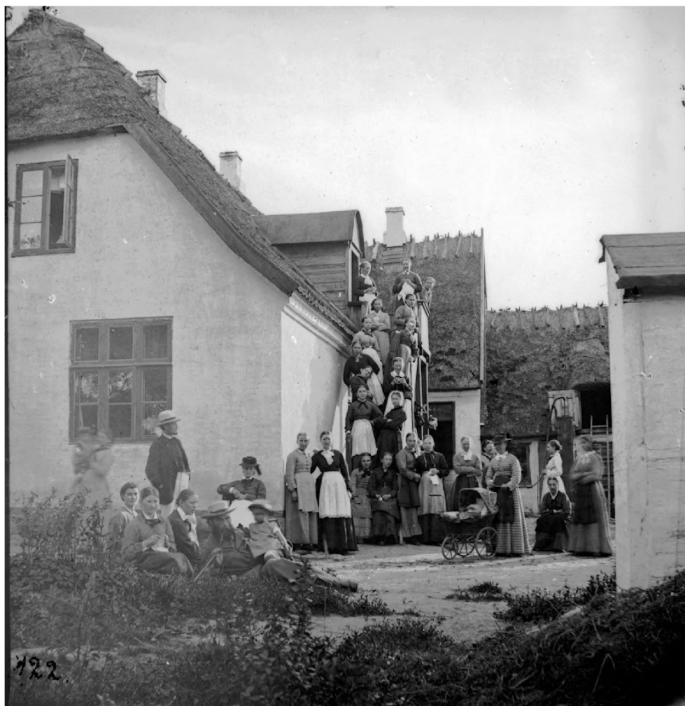
Kongelig Hoffotograf Peter Elfelt havde dette stereobillede med i hans salgsmapper, og her kan man se, at billedet viser Freerslev Højskole.