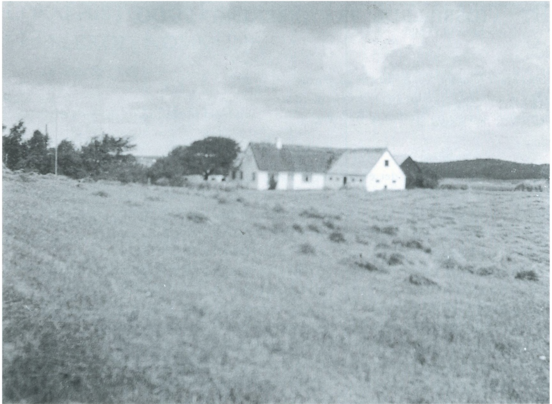
Hjemmet på Strødam ca. 1920

vene ud til den Størrelse, de skal have. Far havde en lang Kniv paa Skaft til at skære paa langs af Bedene og en anden med 4 Knive paa til at skære paa tværs. I Engene derhjemme var der det herligste Blomsterflor, som vi Børn fyldte Moders Vaser med hver eneste Søndag, Hjertegræs, Forglemmigej, Klokkeblomst, Engkarse, Kappeljejer o.s.v. Naar Far havde slaet Enggræsset til Hø, maatte vi bære det ind paa Stænger, da Engen ikke kunne bære Hest og Vogn.