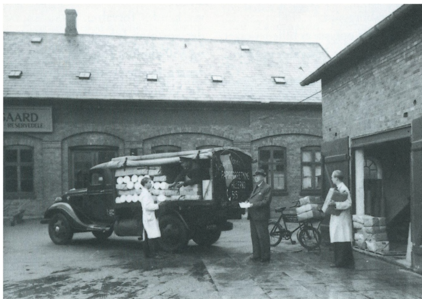
Nedkørslen til maskinfabrikken med Nordsjællands Papirlager til højre.