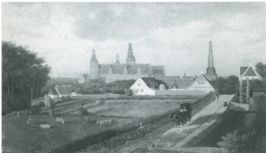
Udsigt fra stutmesterboligens 1. sal, 1843. Kunstner ukendt.