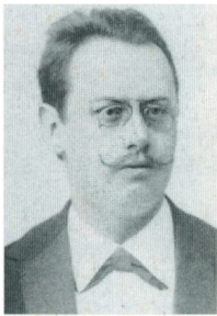
C. C. Brandt, Fotografi 1895.

rie som kirkens første kvindelige organist. Der skulle derefter gå mere end 100 år, før man igen ansatte en kvinde - som assistent.