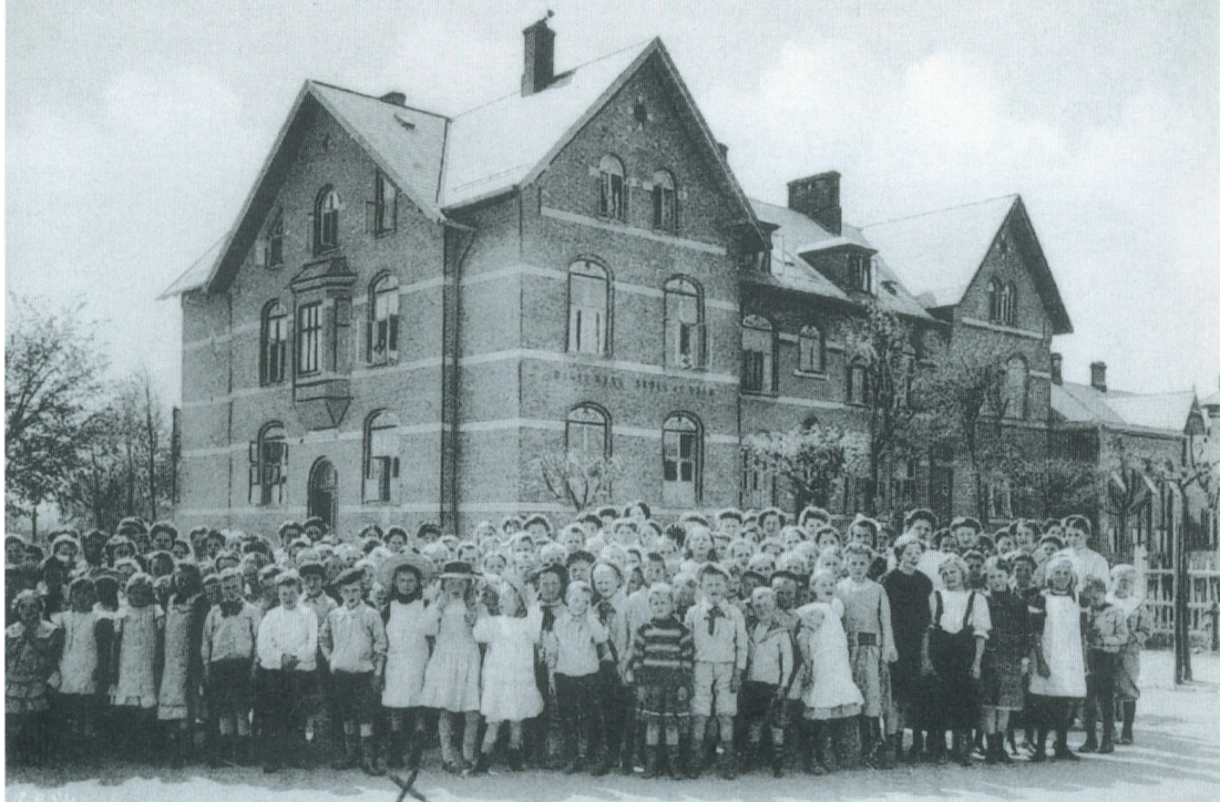
Frederiksborg. Marie Mørks Skole og hjem.

det kom frem. Og så en høj mahognichiffoniere, kun med skuffer, plus fars stol, en engelsk klubstol, som jeg den dag i dag bruger til skrivebordsstol.