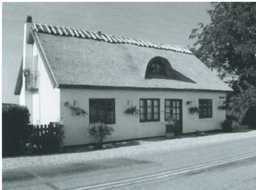
Harløsevej 230.