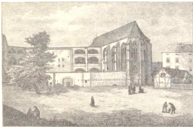
Fig. 3. Slotskirken og Stottet i Wittenberg 1864.

Kjøbenhavnerne havde en Sangforening, som talte op imod 50 Medlemmer. Tit kom om Aftenen de prøjstiske Officerer hen for at høre paa dem, naar de sang deres Fædrelandsfange; men i disse Dage var det Salmetoner, som lød i de gamle Haller. Sangerne fik