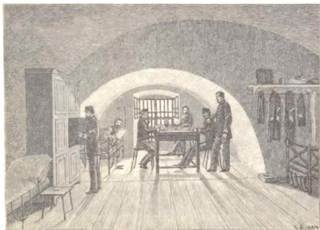
Fig. 2. Underofficerskafematten i Magdeburg. (Efter en Tegning af een af de Menige).

Lige over for deres Præst viste Folkene sig aabne og tillidsfulde, saa de kom frem med, hvad der laa dem paa Hjærte, stort og smaat, dog ikke strag. Der skulde gjerne gaa nogle Dage, inden Ijen blev brudt. Derfor gav jeg mig god Tid paa hvert Sted, mindst en Uge, og særdeles saa meget som muligt iblandt Mandstabet. For at saa