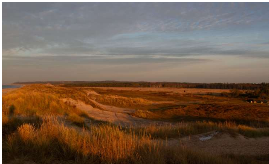
Stængehus tidligt efterår 2016.