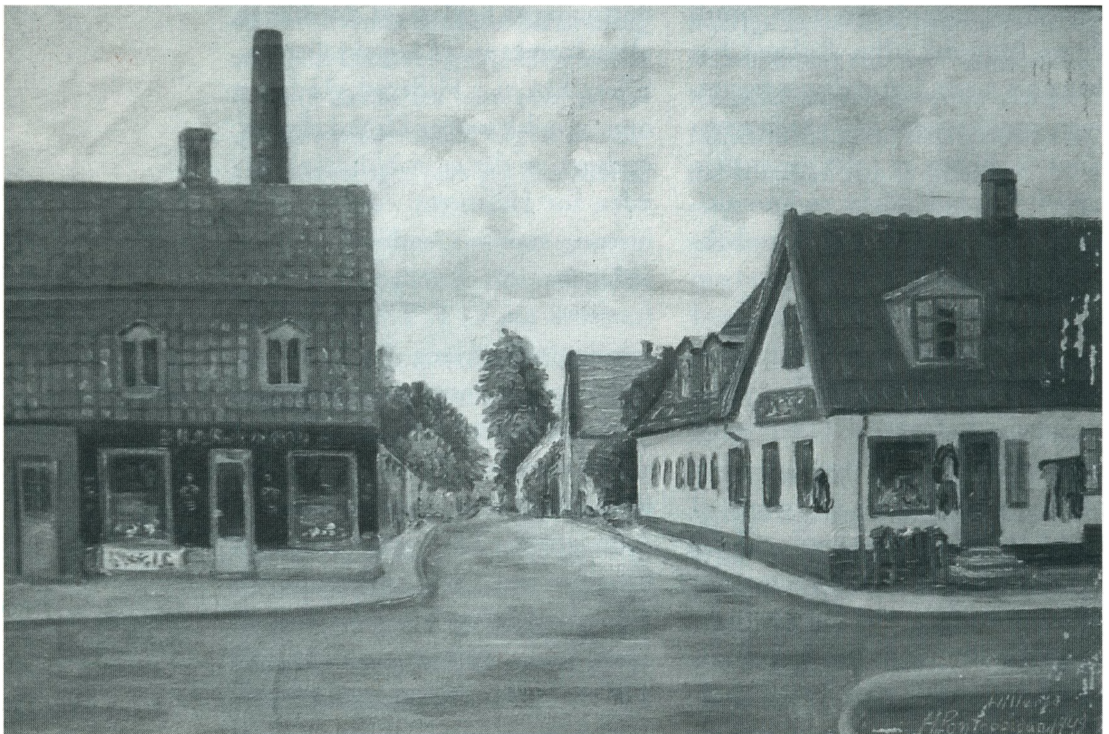
Hjørnet af Frederiksværksgade og Løngangsgade, malet af H. Pontoppidan. Privateje.

Lokalthistorisk Forenings udstilling af Hillerød-malerier i bibliotekets vandrehal finder sted fra 8. november til 31. december 2003. Forhåndsinteressen er stor, og 85 har givet tilsagn om udlån. Malerierne er nu blevet fotograferet og registreret, og bestyrelsen er i gang med den egentlige planlægning.