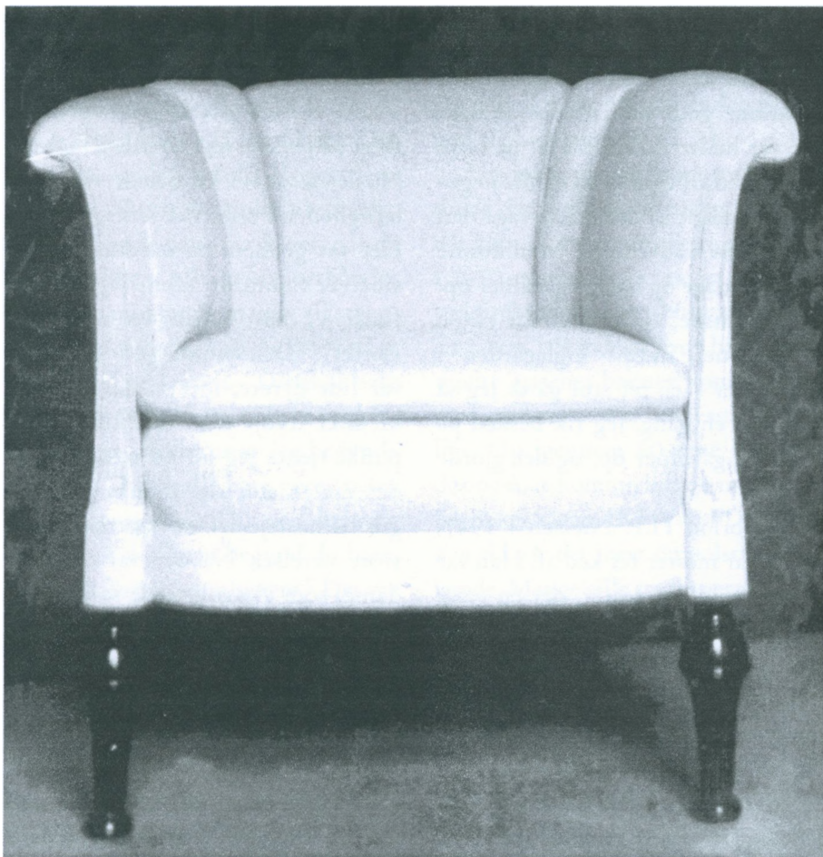
Det flotte svendestykke.

Der var megen arbejdsløshed i 1930-erne, men jeg var heldig. Jeg var kun arbejdsløs i korte perioder. Mellem 1930 og 33 arbejdede jeg en uge her og en uge hist både i Helsingør, Helsingørsgade og i Al-