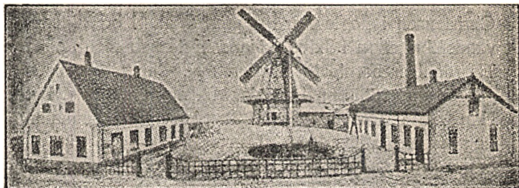
Møllegaarden efter Damgaards Ændringer.

Den gamle Hovedindgang fra Haven med de tre Stentrin under de høje Lindetræer forsvandt, og ligesaa erstattedes de smaarudede Vinduer med moderne fir-kantede. Alle Skrænter ved Møllen lod Damgaard beplante. I Aarenes Løb bortsolgte han det meste af Jorden, som hørte til Møllen, saaledes ogsaa en Del af Mølletoften. Da Byen i 1896 fik Gasværk, lod han indlægge en 10 Hestes Gasmotor i Møllen som Hjælpekraft. Denne Motor ombyttedes i 1912 med en 29 Hestes Sugegasmotor. Bageriet blev ombygget, og der blev anskaffet en ny moderne Bagerovn fra Fabrikken Strømmen i Randers.