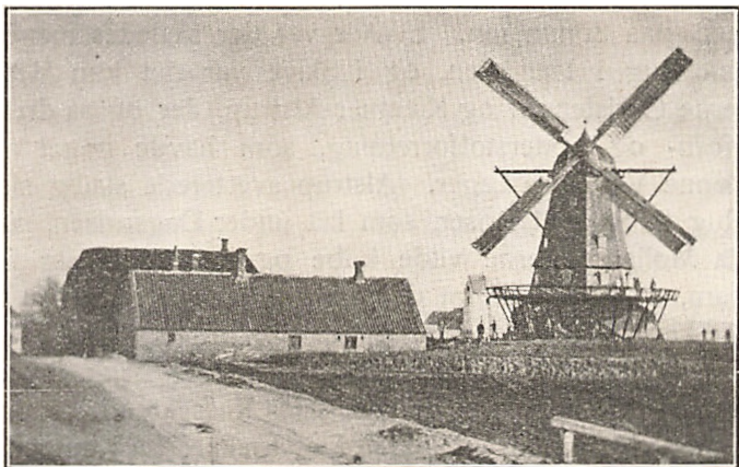
(Møllen set fra Vest, taget 1882).

kendt. Udviklingen og Konjunkturerne førte med sig, at det danske Landbrug i disse Aar maatte vende sig fra Produktion af Korn og Fedekvæg til Salg og gaa over til Mejeridrift. Denne Vending havde en afgørende Indflydelse paa Mølleriet. Det blev nødvendigt, at selve Møllebruget forbandtes med Handel med indførte Kornprodukter. Men da Landbruget i disse Aar i mange Henseender stod famlende og ikke kunde faa Driften ind i et fast Leje, blev ogsaa Kornforretningen undergivet tilfældige Svingninger og lune-fulde Konjunkturer.