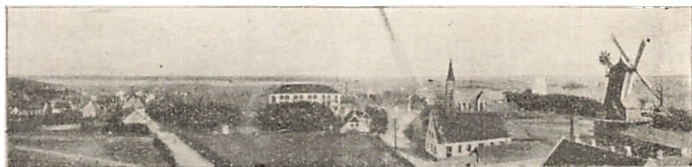
Skive By 1905.