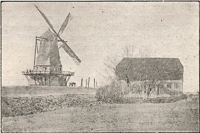
(Møllen set fra Øst, opført 1856 efter Branden 1855).

Endelig i 1857 blev Møllen atter opført og fuldfærdig uden større Uheld