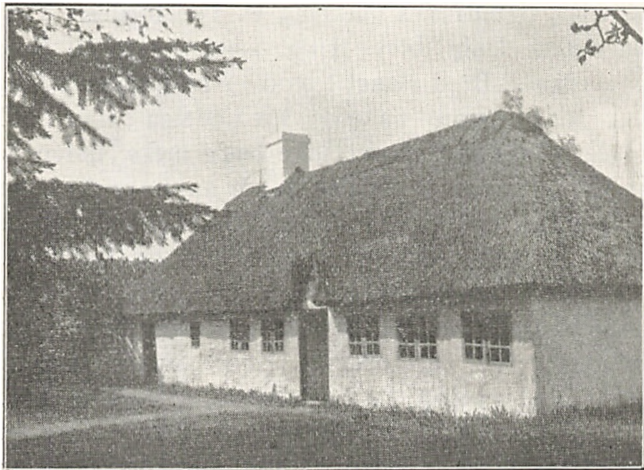
Sallingbohuset paa Lyngbymuseet.

Jylland ligeledes vidtudbredte Udtryk Nøs , dvs. „Nødhus“ af „Nød“ = Kreatur. Paa Mors, ligesom i Ty, Vendsyssel og Himmerland, foretrækker man at kalde Salsset for Raaling , af ældre dansk rathe-lang ; og Kostalden kaldes paa Mors og i Ty for Støld . En tredje afvigende Type har atter Hardsyssel; her kaldtes Saiset i ældre Tid ogsaa Isæt-