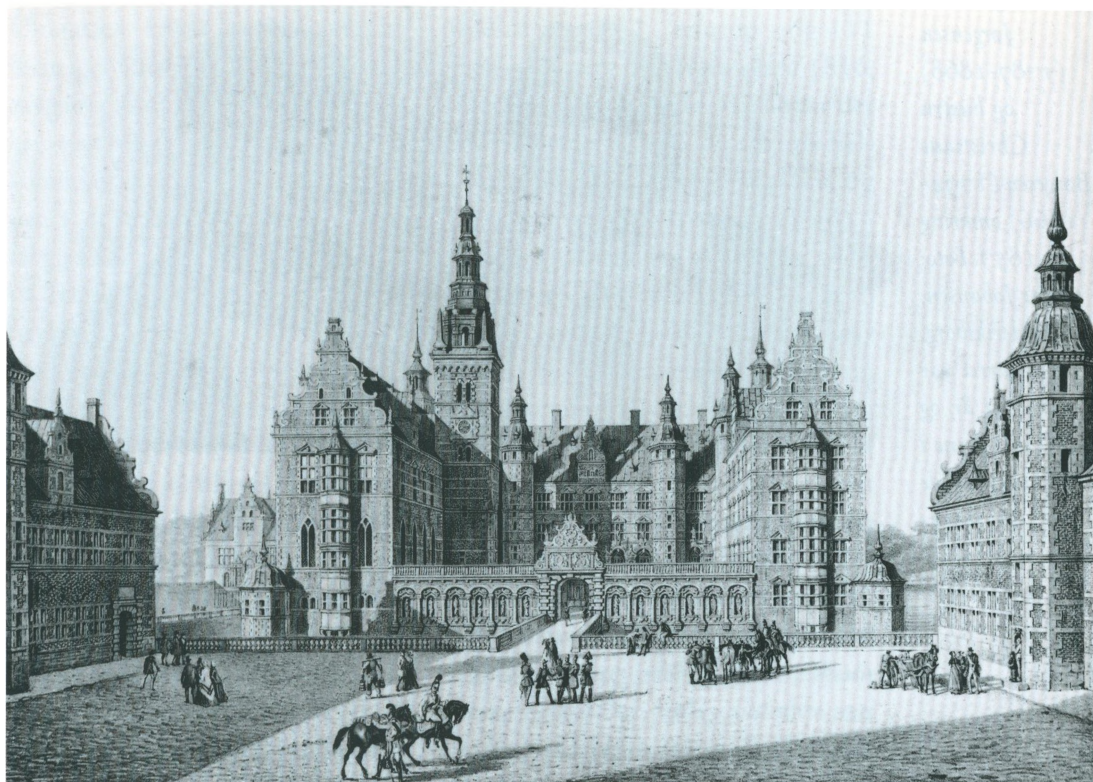
Frederiksborg Slot med Livgarden til hest. Heinrich Hansen. U.å. Det Kongelige Bibliotek