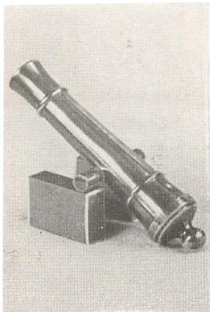
Miniature-Udgave af Drakenbergs Signal-Kanoner.

aldeles ikke undrer os, for altid skulde han gøre Haneben til Piger saavel som til Enker, skønt han hentede sig mangen en Kurv. Her logerede samtidig 6—7 tyske Skærslibere og Glarkræmmere af den Slags, man ellers kaldte