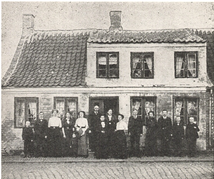
Hattemager Borups Hus i Sønderbyen.

ved Allinggaard for at naa herop, hvor det store Sommermarked netop begyndte 22. August og varede i 3 Døgn.