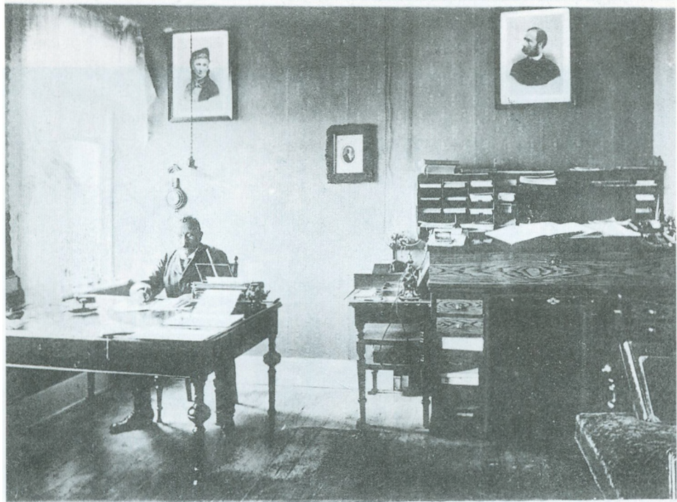
Auktionsholder Chr. Galberg-Olsens Kontor - Hillerød.