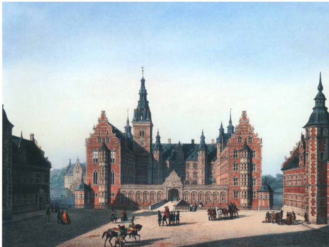
Frederiksborg Slot før branden, med gardere til hest og til fods. Litografi, u.a.