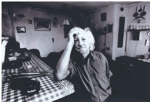
Spidsmusen fotograferet i sit hjem 1993.

redderne blot nævne, at en bestemt navngiven sygeplejerske, som Spidsmusen var bange for, havde vagten på skadestuen på Hillerød Hospital, så sprang han op og forsvandt.