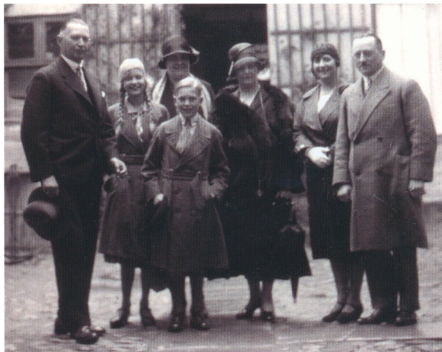
Familiefoto fra gården Slotsgade 3, ca. 1932. 6

skrevet til Neu-Mönster men ikke erholdt nogen Svend og har neppe nogen Tro til at faae nogen derfra. Skulde det imidlertid skee, da har jeg en Væv i Arbeide. Som De ved er min Hensigt at udvide mit Lille Fa-