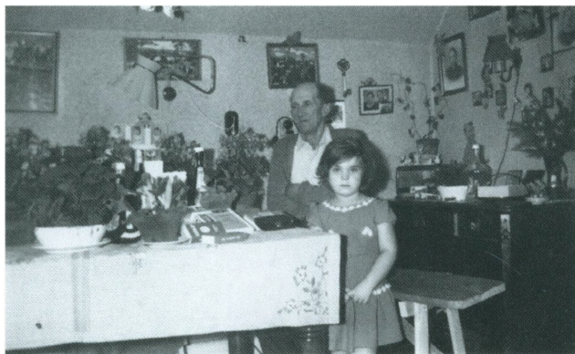
Min morfar og mig ved hans 65-års fødsels- dag den 22. december 1959.

i Hillerød, men jeg husker ikke hvor. Derudover var der mors store familie i Frederiksværk, som også tit kom på besøg. Og noget familie fra Helsingør, så der var masser af venner og familie, men ingen børn på vores alder.