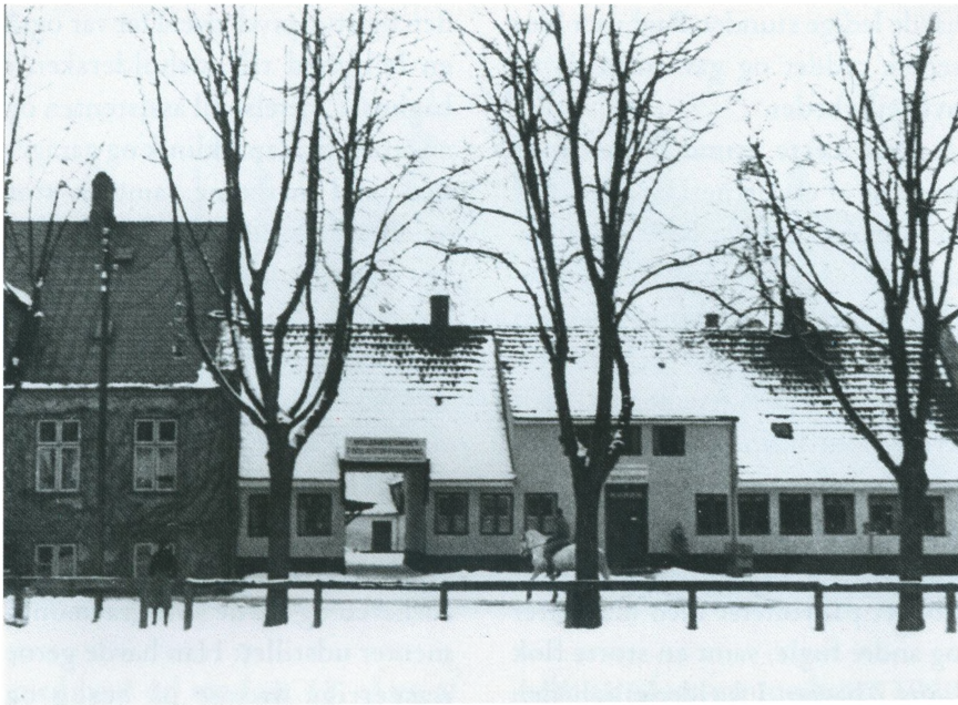
Slangerups- gade 8, nedrevet 1950. Foto 1940'erne