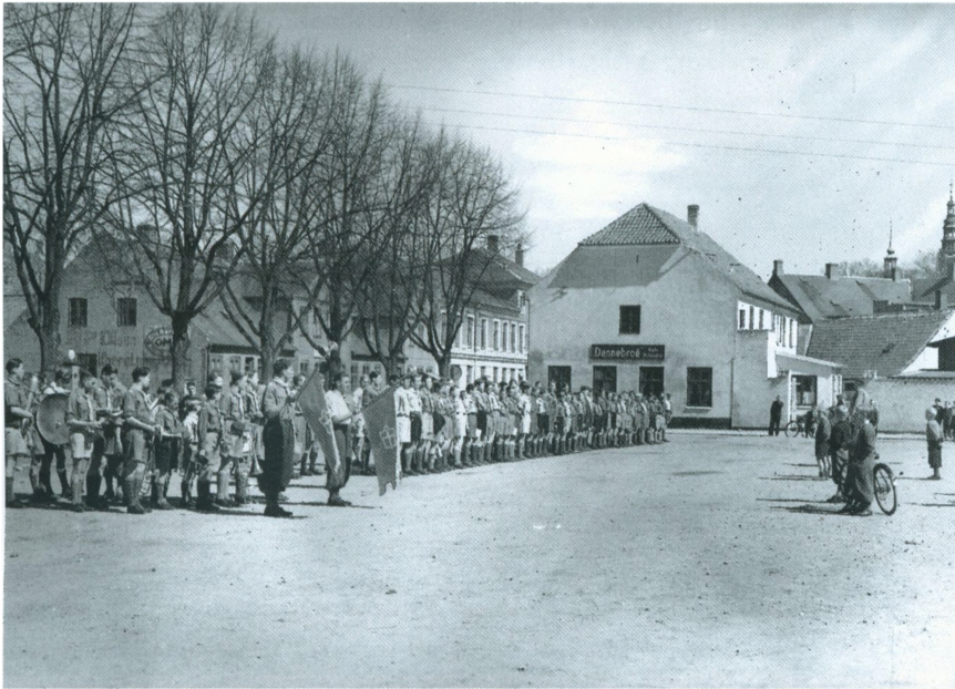
Markedspladsen 1937 med FDF-parade.

Så kom en af gadens flotteste ejendomme med røde sten og karnapper med sprossevinduer. Her var også kælderlejligheder, som næsten lå oven på jorden på grund af skråningen, men de blev også nedlagt.