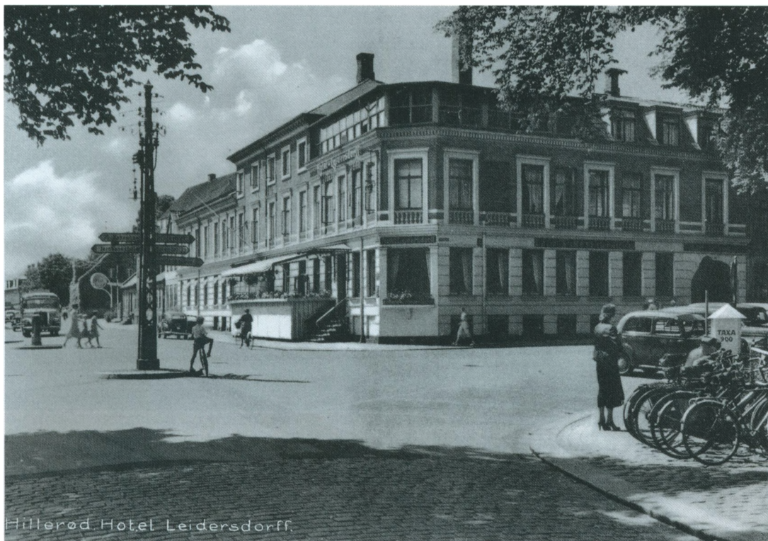
Slangerupsgade set fra slotsbroen. Til højre Hotel Leidersdorff.