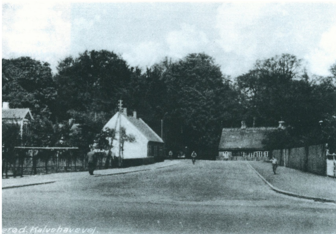
Kalvehavevej, set fra Frederiksværksgade, 1950'erne.