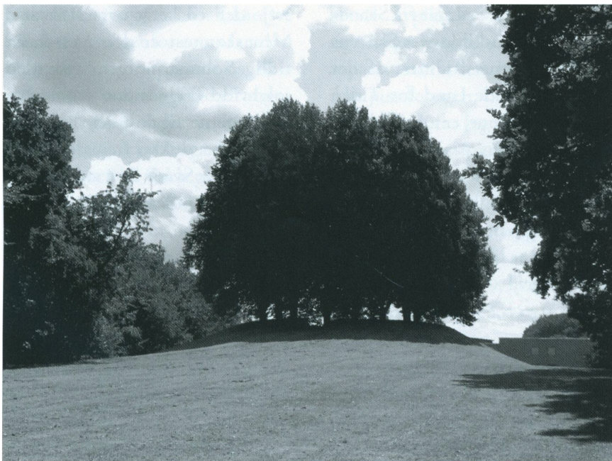
Skansebakken set fra nord med bebyggelsen Skansedal i baggrunden, 2016. Foto: Mogens Hansen

Udsigt fra Skansebakken mod nord med Fredensborg Slot i baggrunden, 2016. Foto: Mogens Hansen