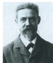
Ernst von der Recke. U.å. Det Kongelige Bibliotek. Hans beskrivelse af Skansebakken er fra 1894. Se note s. 16

Saa løfter sig en mægtig sammenhængende Skovmasse - den største i Danmark - mod Horizonten; nærmest ses Skovene om Frederiksborg, Lille Dyrehave, Tyvekrogen og Stenholt Vang, bag dem Grib Skovs bølgeformede Terrain, der op mod Maarum hæver sig til en endnu større Højde end Skandsebakken. Mod Vest højner Fruebjerg sig med en enkelt Kuppel af Trækroner over de omgivende Toppe, nærmere ses de slanke Skorstene af Teglværkerne ved Gadevangen ragende op over Skoven. Langs Skovgrænsen i Forgrunden kommer