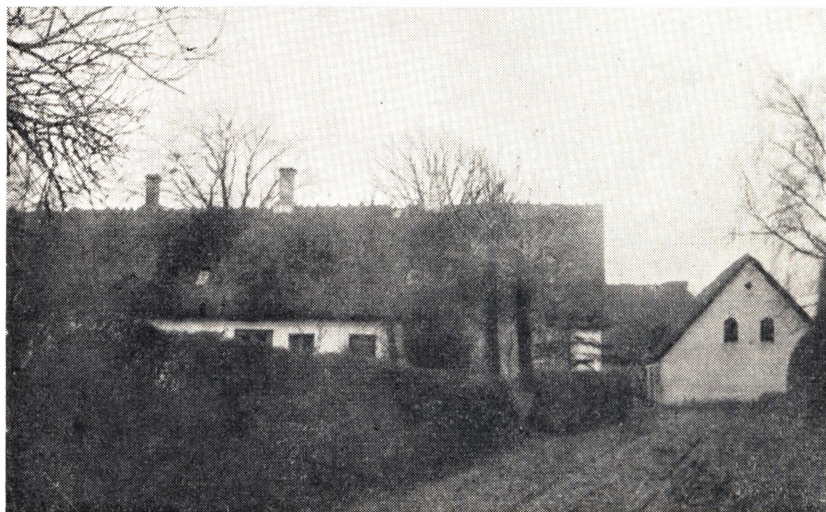
Højstrupgaard set fra Nord.