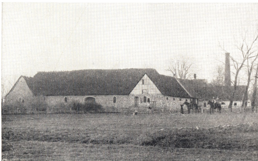
Højstrupgaard set fra Syd.

I Købet medfølger 4 Heste, 12 Køer, 2 Tyre, 3 Kalve, 4 Faar, 2 Svin samt Fjerkræ; endvidere 1 Fjedervogn, 3 jernakslede Vogne, 2 Mergelkasser, 2 Tørvesluffer, 3 Jernharver, 3 Jernpløve, 3 Svingharver, 1 Tromle; endvidere to Sæt Seletøj, Grimer m. v. 1 Rensemaskine, 1 Hakkelsesmaskine, 2 Sæt Høstharver, 4 Læder-Stolgrimer, 2 Sæt Høstreb, 1 stor Kerne, 1 lille do., 36 Si-