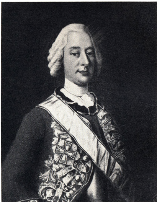
GENERAL ANDREAS HAUCH 1708–1782