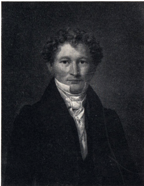
KORTSTEMPLINGSFORVALTER, KAMMERJUNKER CARSTEN HAUCH 1801–1854