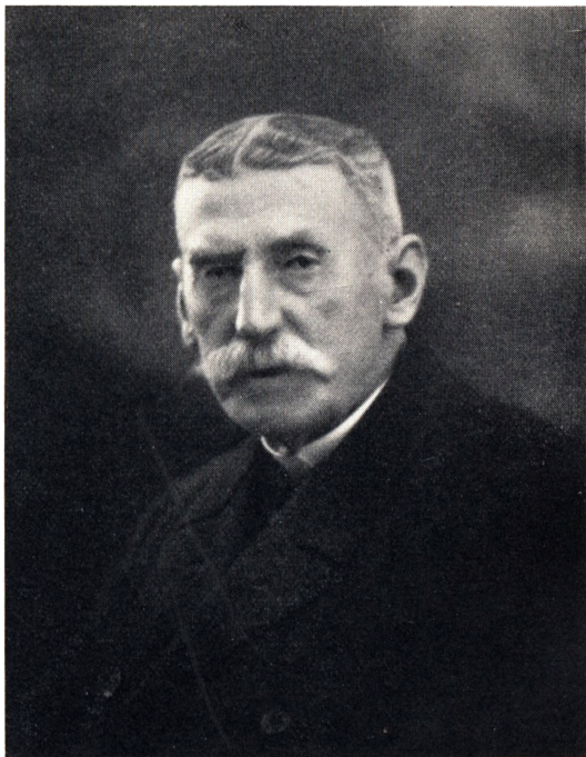
HOFJÆGERMESTER ALFRED HAUCH 1845—1938