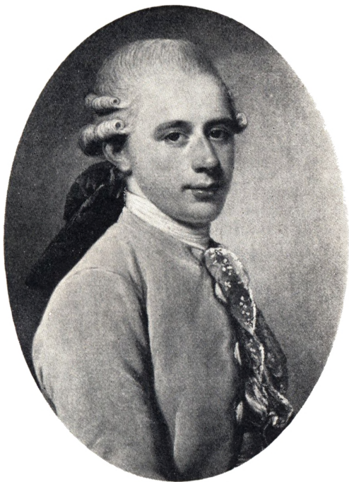
GENERALPOSTDIREKTØR, GEHEJMEKONFERENSRAAD FREDERIK HAUCH 1754–1839