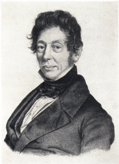
DIGTEREN PROFESSOR, ETATSRAAD CARSTEN HAUCH 1790—1872