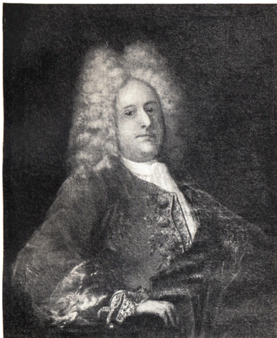
NORGES STATHOLDER DITLEV WIBE 1670—1731 TIL BARONIET ROSENDAL