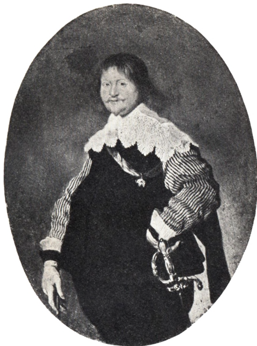
RENTEMESTER PEDER WIBE TIL GJERDRUP DØD 1658