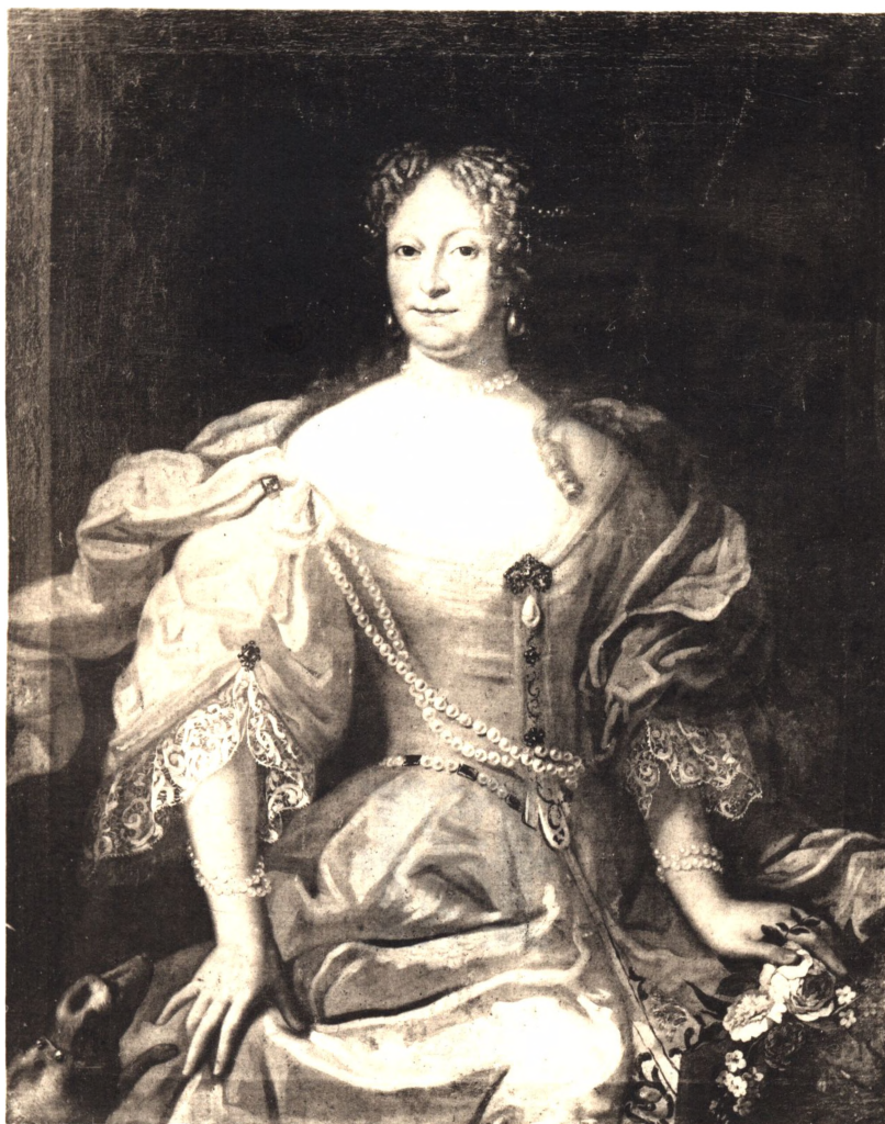
IDA AULEFELDT FØDT POGWISCH 1619—79