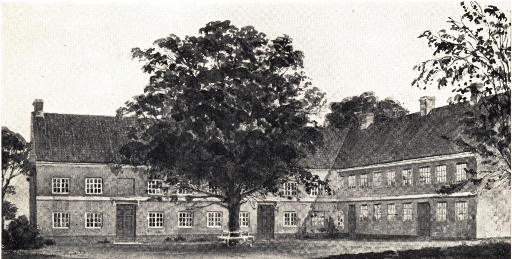
Bakkehuset 1925. Efter Akvarel af Viggo Dahl.

beregnet paa Gardisterne, og Kongen ikke holdt Hof paa Frederiksberg, gav Huset ingen Indtægt, hvorfor han ansøgte om og fik Fornylse af Kroprivilegiet mod Forpligtelse til at lade Drikkevarer komme fra København og erlægge en aarlig Afgift af 4 pCt. af Indtægten. I Bülow's Tid fandtes paa hans Ejendom et Vaaningshus af Mur- og Egebindingsværk, 30 Fag langt, en Vinkelbygning til Opstalding af 70 Heste, en Bygning med Gæstestue, Vagtstue, Officers-, Mellem- og Bagstue samt Brygge- og Brændevinsrum og en Keglebane. I 1753 averterede Bülow Bakkehuset til Leje, enten den nederste Etage med 4 Værelser eller den