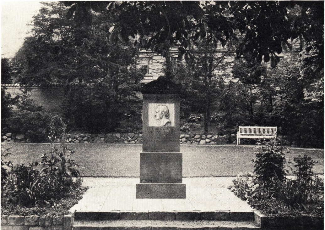
Mindestøtten i Bakkehusets Gaard (flyttet hertil 1937).

sænket og gjort større, Tapeterne erstattet med Paneler. — Hvad man end kan bebrejde Hamm for hans smagløse Omkalfatring af Huset, bør det dog erindres, at han i Maj 1833 af Bakkehusets Grund i dens Udkant skænkede et Areal af o. 100 Kvadratalen, paa hvilket der rejstes en Mindestøtte for Knud Lyne Rahbek og Hustru, »sat af Medborgere« efter forudgaaende Opfordring til at yde