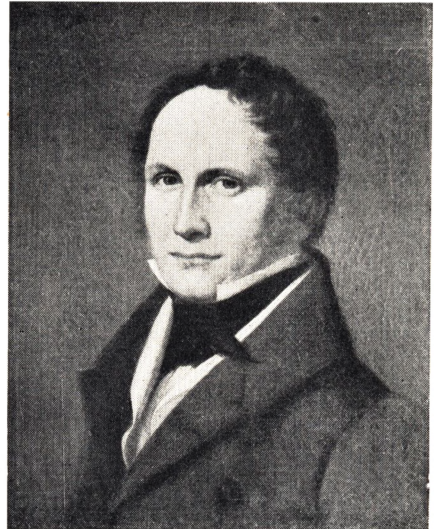
Just Mathias Thiele.

Den Rahbekske Fløj er, som Façadeprospæktet paa Rahbeks Skydeskive viser, uforandret i sit Ydrebillede, nu dog kun med den ene af de to gamle Linde foran Indgangsdøren. Bortset fra mindre Forandringer er ogsaa det Indre bevaret. Dette stadfæstes af J. M. Thieles indgaaende Beskrivelse af Lokalteterne som ogsaa af Digteren C. K. F. Molbeck, der i sin Barndom hyppigt færdedes paa Bakkehuset og endnu saa sent som 1883, da han udgav sin Faders Brevveksling, bevidner, »at den berømte Hjørnestue, der i en Række af Aar var et af Aandslivets