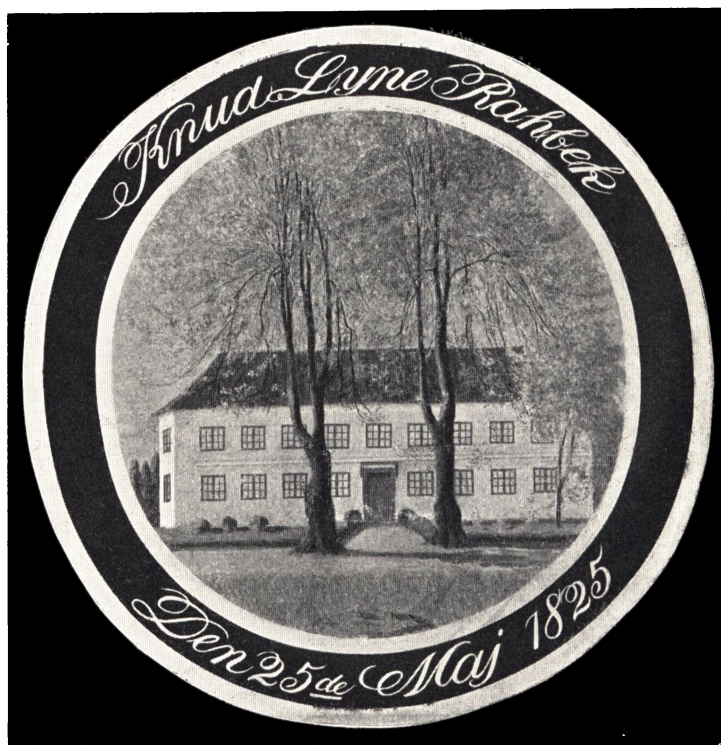
K. L. Rahbeks Skydeskive fra 1825.

Denne Ejendom, hvis Oprindelse gaar langt tilbage i Tiden, formodes at