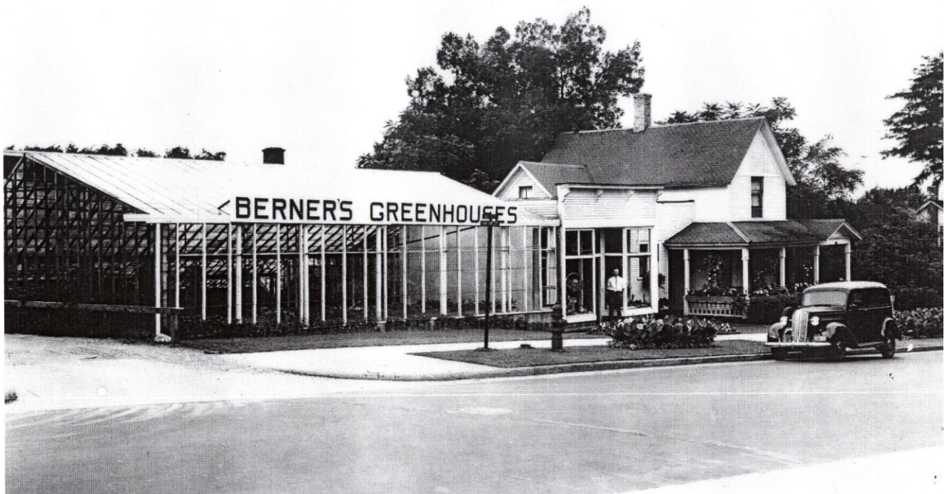
Grand Rapids, Michigan, USA o.1938.