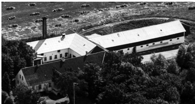
Kornerup Lille Mølle med bageri 1949