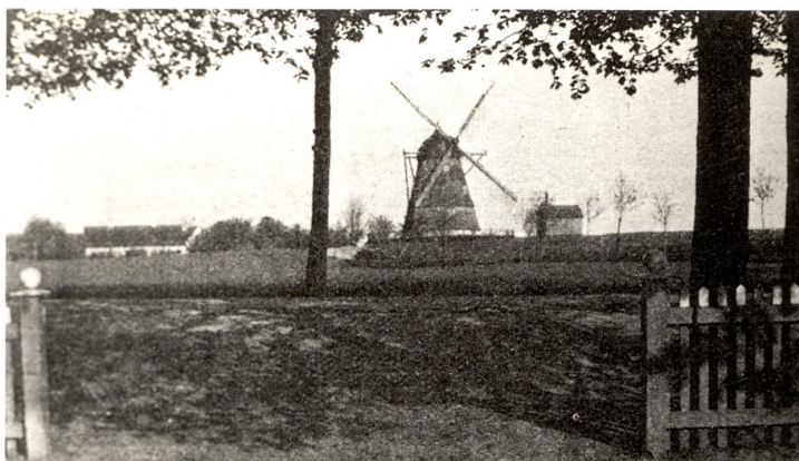
Ågerup mølle og bageri

havde ikke mange penge at gøre godt med, da der ikke var noget særligt efter hendes tidligt afdøde mand. Sønnen Ludvig holdt således begge sine søstres bryllup. Hendes gamle kønne rødbedekrukke fra Ågeruptiden blev i Tjørnemark, og den står nu hos mig og pynter. Jeg har ligeledes deres Chr. VIII's stuebord, som blev sendt til min morfar, da han var blevet lærer på Falster, og som blev købt på auktion af min mormors moster i Tjørnemark efter deres død, og siden endte det hos mine forældre.