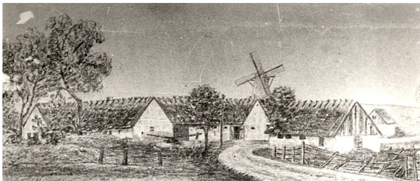
Lejre mølle og bageri, gammel tegning.