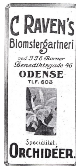
Kraks Vejviser II 1921, Odense

Regular Army Officer i US Army 1940-1964. Dekoreret med Purple Heart & Bronze Star. Captain & Intelligence officier. Bosat 2016 i Summerville, South Carolina. Vi besøgte familien i 2003 og 2005 i West Colombia, hvor de da boede. Gift 12-6-1944 i Washington med