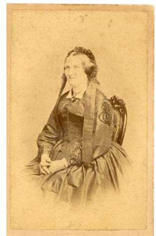
I brudedragt 1866