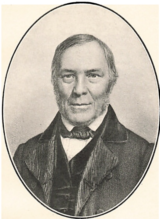
JOHANN HEINRICH LUDWIG WEITEMEYER, 1784–1864. Efter et Litografi fra c. 1860.