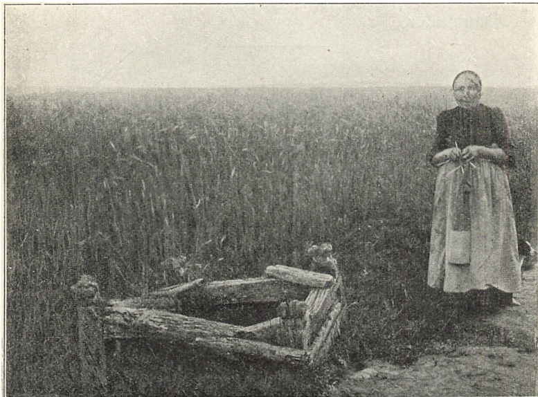
Jomfrukilderne i Soderup.

Gården; men før der kom Folk til, var disse borte. Man fandt Døtrenes Lig, og da man løftede dem op, sprang tre Kilder frem på de Steder, hvor deres Ho-