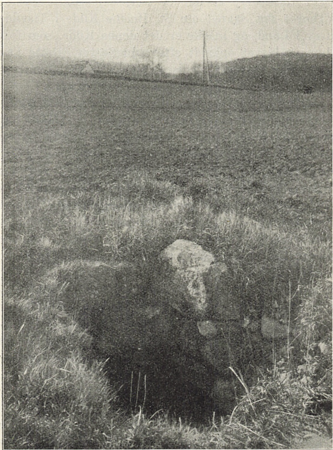
St. Karens Kilde.

være forvekslet med Asminderup i Ods Herred, hvorfor Kilden og Graven anførte Sted i Trap må henlægges til Højby Sogn.