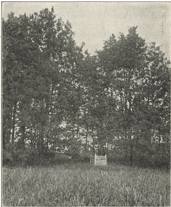
Hellig Kors Kilde i Ondløse.

Stenlille Sogn) fandtes ved Saltofte. J. H. Larsen nævner ca. 1835 i en utrykt Indberetning 1) , at der ved Saltofte findes to Kilder: B r u n s og B r ø n s Kilder, begge med ypperligt Vand. Selv i varme Somre blev de ikke tørre, men om nogen af disse Kil-