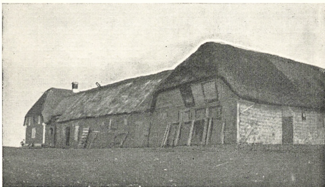
Gammel Bjerregaard Den nordre Fløj af den oprindelige Gaard