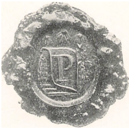
Signet tilh. den danske gren av slekten.