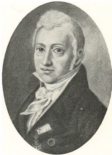
Justitsraad Bertel Bruun 1767—1827.