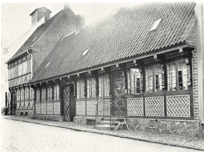
Apostelhuset i Næstved