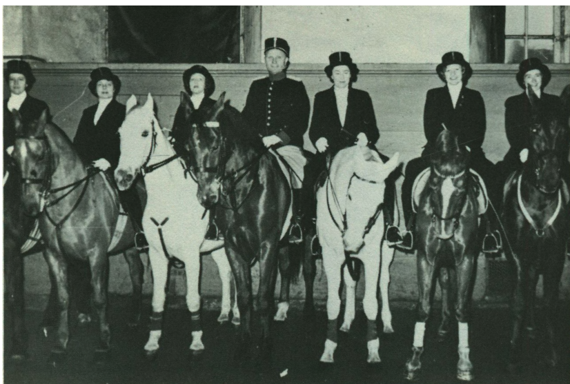
Berideren hyldes på sin 50-årsdag

dekjole samt høj silkehat med eller uden tylsslør. Det blev gjort gældende, at ridesædet i damesadel bl. a. bevirkede uregelmæssigt tryk i rytterskens bækkenparti og derfra op gennem rygsøjlen. Endvidere hævdede man, at der opstod hyppige trykskader på hestens mankeparti. Resultatet var, at mange damer opgav brugen af damesadel. I dag rider alle damer i herresadel, og det har jo vist sig, at de er jævnbyrdige med de mest fremragende mandlige ryttere. Som kuriosum kan nævnes, at det, da kong Christian VII's unge engelskfødte dronning Caroline Mathilde 1770 vo-vede at vise sig til hest i herresadel i Det kgl. Ridehus og på ridebanen, vakte stor forargelse hos nogle bornerte københavnerne.