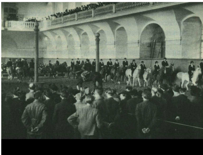
Kommandoridning, 36 ryttere

og ramme de linier, man skal og vil med hesten i rigtig bøjning og rigtigt tempo. Rytteren må ikke glemme at lægge sidebevægelser, for- og bagpartsvendinger og baglæns march ind i øvelserne og ikke glemme at tage hesten op i skridt og klappe den, når den har gjort sig fortjent til det. Hesten forstår både straf og ros. Og så: læs nogle af de mange ridebøger.