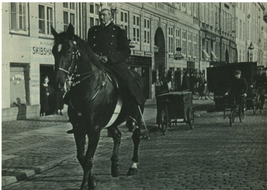
Der rider en Konge i Sol og i Blæst

der, kastede nu med vanlig præcision to halve rundtenommer op i krybben til hver hest. Undertiden kunne kongen give sig god tid til at sludre hyggeligt, men til andre tider gik det som en stormvind.