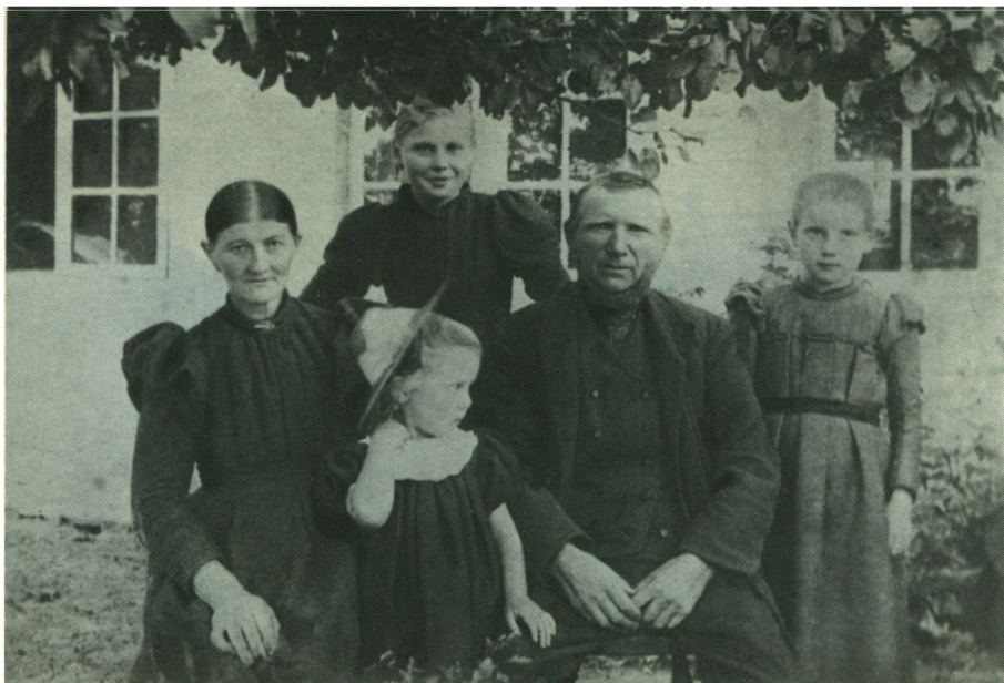
Billede af mit Barndomshjem