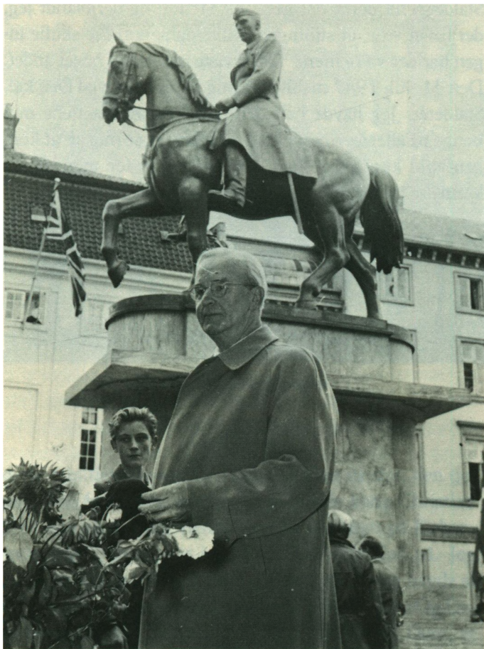
Rytterstatuen på Skt. Annæ Plads