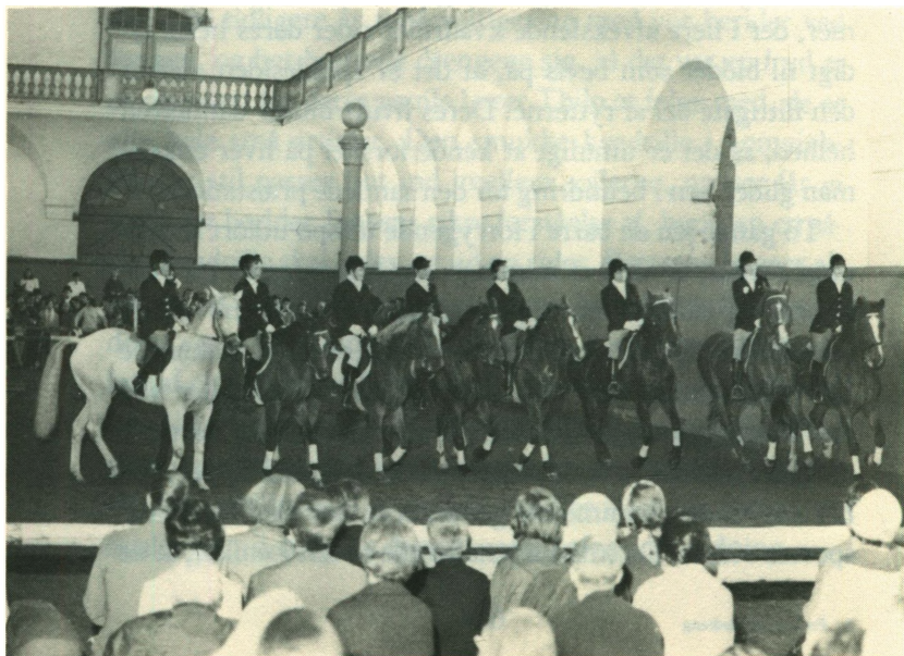
Otte unge damer. Kvadrilleridning