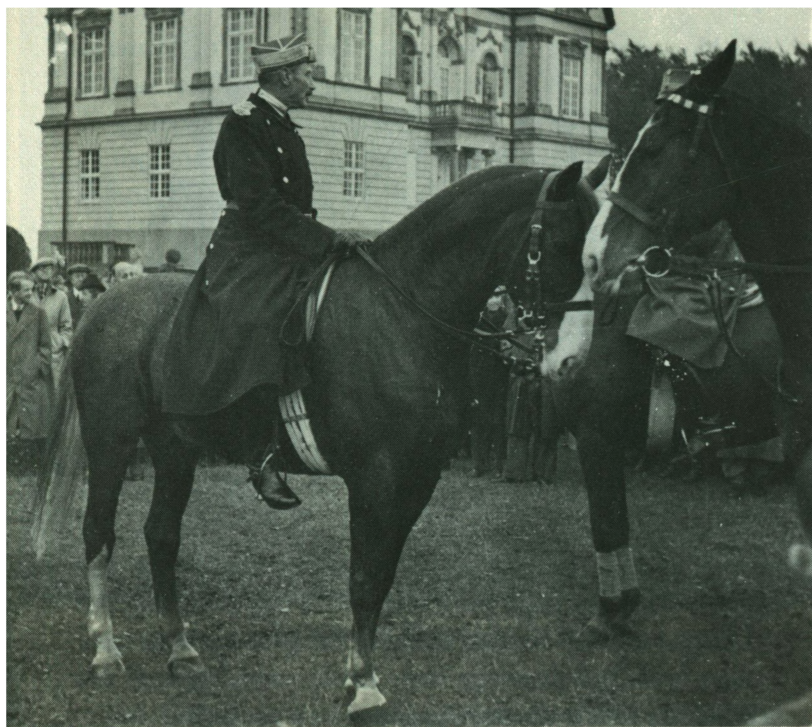
Hubertusjagt 1939. »Rolf«

Den kgl. staldetats personale bestod af: chefen, berideren, vognmesteren, to kuske, fire-fem biløbere, to stafetter og en ekspeditionssekretær på kontoret. Jeg skulle som berider ride kongens heste og navnlig værne dem til trafikken.