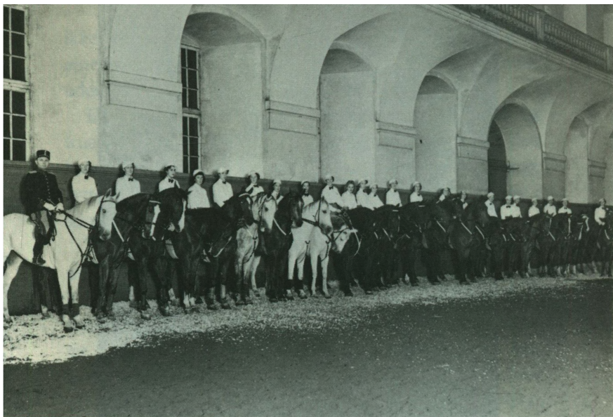
24 unge piger

Lynhurtigt er nu forhindringerne fjernet af de raske vol-tigedrenge, og man ser pludselig et utal af søde unge damer, der i flere afvekslende kvadriller rider deres heste lydigt til biddet som bevis på, at det er spindesiden, der er den flittigste del af rytterne. Deres hvide bluser danner en helhed, så det er umuligt at kende forskel på hver enkelt, man glider hen i beundring for den samlede præstation.