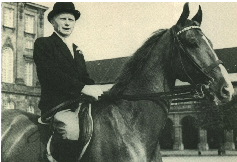
Berideren på Lausbub

Det er med stor glæde, det kan konstateres, at Hendes Majestæt dronningen og Hans kongelige Højhed prinsen sammen ønsker at føre statens traditioner videre.