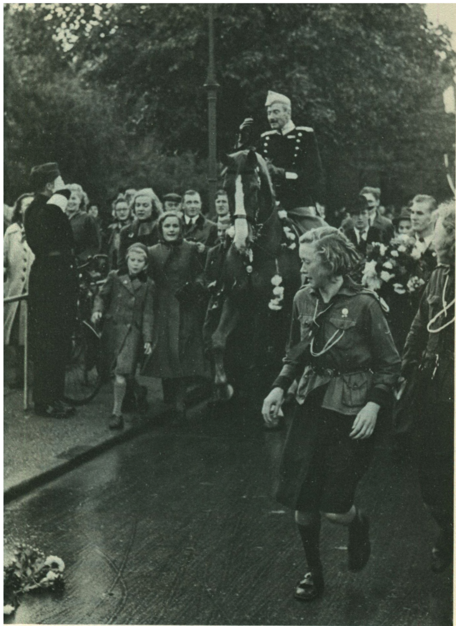
Kongens ridetur på 70-årsdagen. »Rolf«