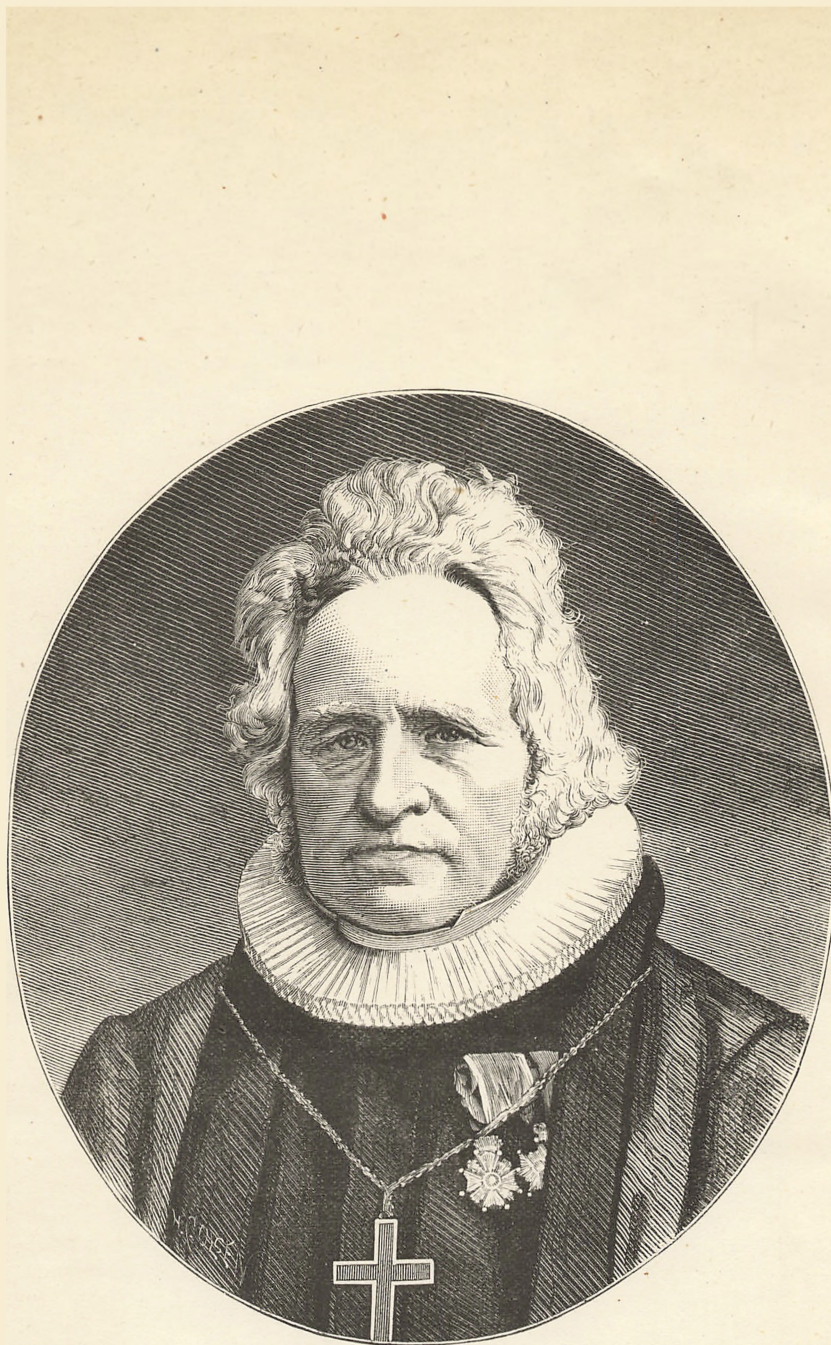
Biskop von der Lippe.