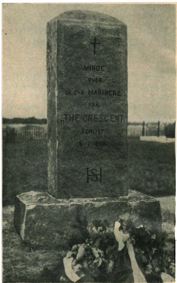
Mindesmærket paa Maarup Kirkegaard.