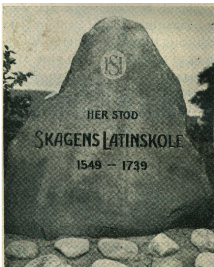
Mindestenen for Skagen Latinscole. (Se Side 92).

en Del af Bøndernes Klager har forekommet Kongen berettiget, naar han Aaret efter i et Brev til Almuen og de kongelige Fogeder udtaler, at Fogederne ikke maa bruge Haardhed, Vold, Uærlighed o. s. v., som det var kommet til hans Kundskab, at de tidligere havde brugt. I samme Brev formanede han Almuen til Lydighed. Den Forordning, Kongen udstedte 1442 mod at bære Vaaben udenfor Hjemmet var ikke, som af flere Historikere antaget, rettet mod de nordjyske Bønder, men gjaldt alle Samfundslag; derimod gav Bondekrigen Anledning til, at Tiendeydelsen i Jylland og Fyn blev forhøjet fra \frac{1}{15} til \frac{1}{10} , saaledes som Tilfældet var i Landets øvrige Egne; det var den saakaldte Bispetiende, der da indførtes her.