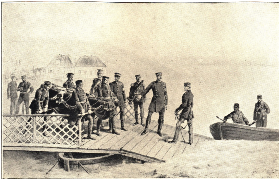
Overførslen af Major SCHAUS Lig ved Alssund. Blyantstegning.