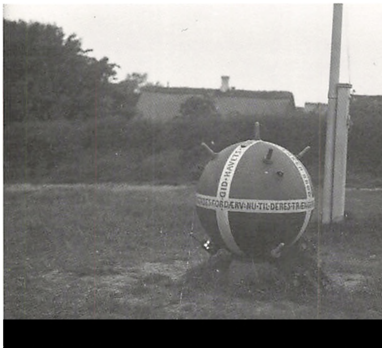
Minebøssen på Krobanken i Sønderho.