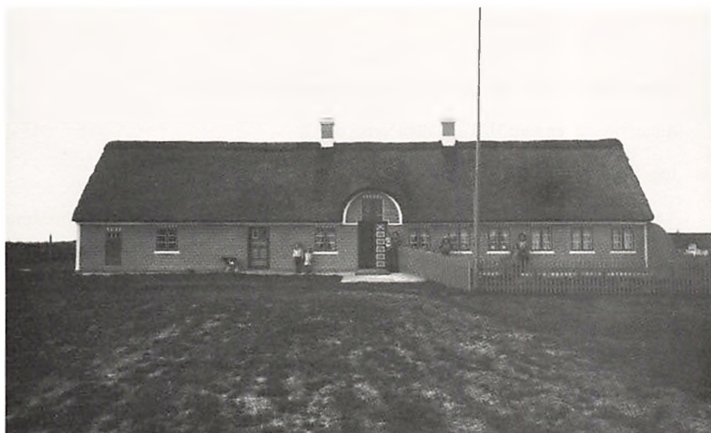
Kaptajn Peder Nielsen Jensens hus f. 2/8 1874. Fotograferet 28/9 1912.