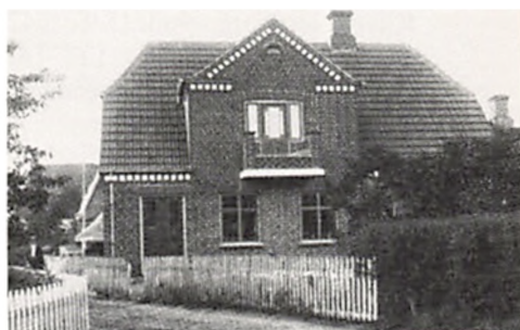
Slagter Sonnichsens hus.