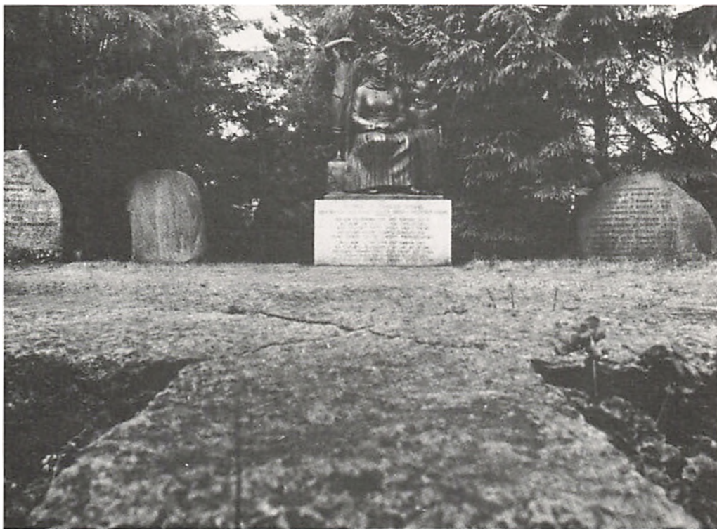
Sømandsmonumentet for omkomne søfolk i Sønderho udført af billedhuggeren Elo. Afsløret den 17/6 1949.