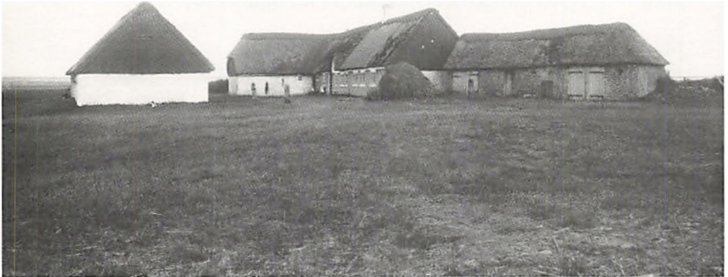
Gårdejer Jes Brinchs gård fotograferet 10/6 1920.