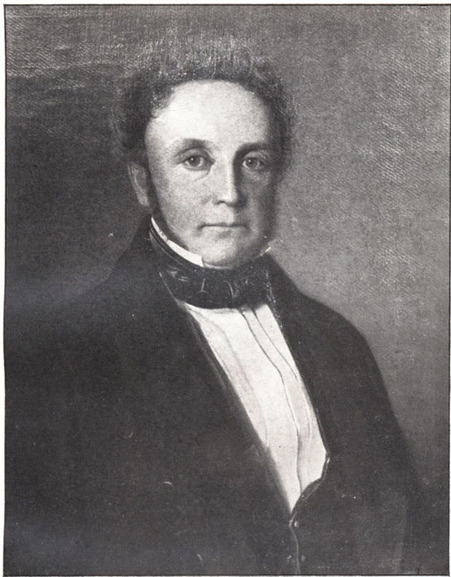
ETATSRÅAD OTTO LINDEGAARD