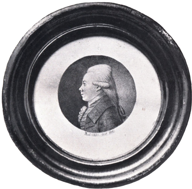
KRIGSRAAD OTTO LINDEGAARD