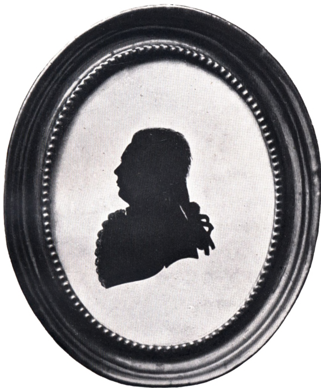
JUSTITSRAAD SALOMON LINDEGAARD