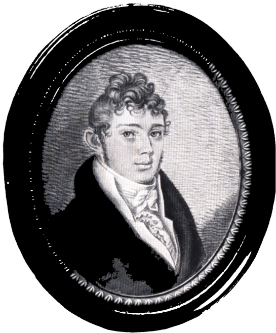
ETATSRAAD OTTO LINDEGAARD SOM UNG