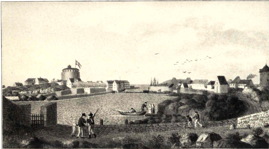
CHRISTIANSØ Nordre Havnen.