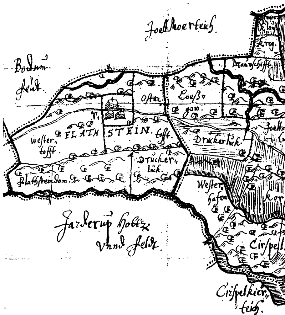
Fladsten gengivet på et udsnit af Johannes Mejers håndtegnede kort over Stollig bymark fra 1641. Gården lå særskilt i den vestlige del af bymarken.