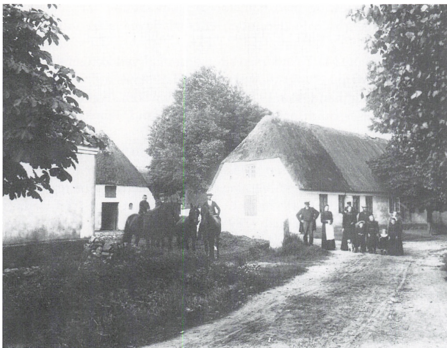
En gård i Ørsted 1901.

dages fourage, og kiørsvenden med 3 ugers underholdning.« 26