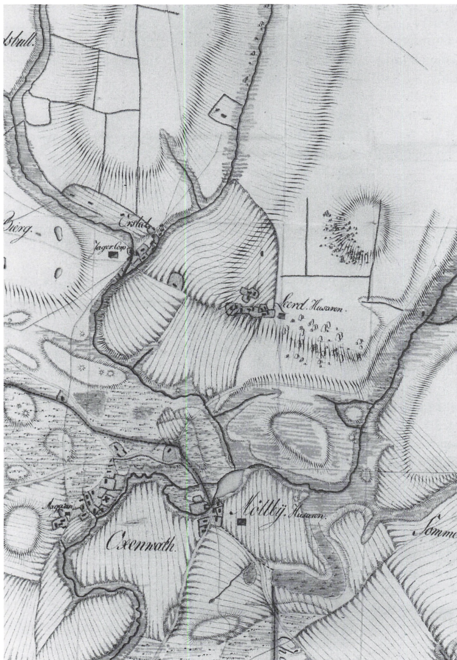
Udsnit af kort over øvelsesområdet ved den store mønstring i 1792 i Oxenvad sogn. Anders Pedersens gård ligger på højdedraget mellem Ørsted og Leerd. Rigsarkivet. IV. Manøvrer – pk. 4a 2. »Krigshistorisk Kort. Danmark. Dagbog over de i Juni 1792 i Holsten forsamlede Troppeskorps«. Håndtegnning.