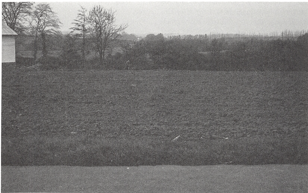
Honninghullet set oppe fra plateauet hen over det hegn, hvorfra opfyldningen skulle være begyndt og fortsat, indtil der ikke mere var noget honninghul.

ninghullet faktisk er for landskabselskere.