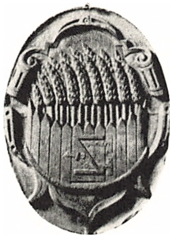
Slægten tor Smedes våben ( Flensborg Museum )