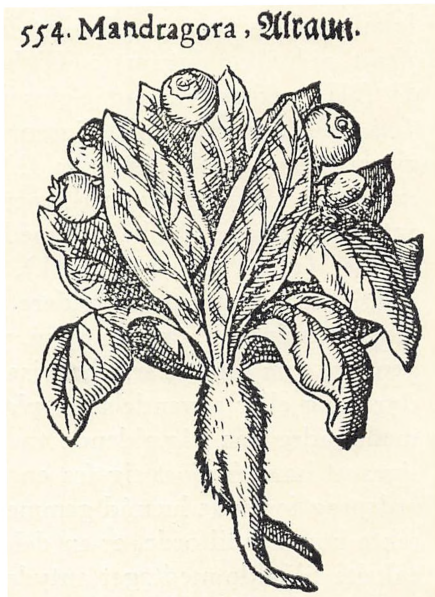
Alruner efter ældre tiders fremstilling.