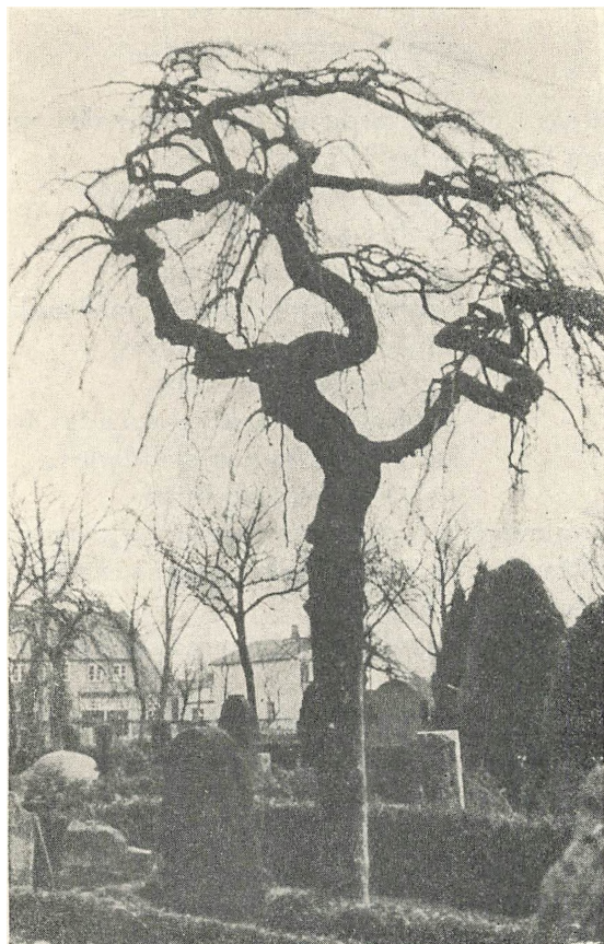
En af de mange hængeask på Skærbæk kirkegård

birkeris at være taget i brug, hvorom bl. a. den yngre runerække bærer vidne 24 ). De ejendommelige troldkoste, som kan fremkomme på b., har været brugt både imod forgørelse og til at forgøre; birkeris har været brugt både som majgrene (se majtræet ) og som fastelavnstris (se dette ord). I Hørup fandtes et b., hvori der var hensat en brand 16 25 ) (se også under træet ).