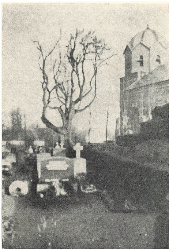
Ask på Sommersted kirkegård. Nu fældet

6. Ambil betegner gråpoppel . I Hinderup by syd for en gård har stået en række a., og man mente, at når de blev fældet, ville en gård brænde. Dette skete i 1893 7 ). Også i kirkebyen Bedsted har stået a., hvortil var knyttet den tro, at når de fældedes, ville byen brænde 8 ) (jævnfør 151: træet ).