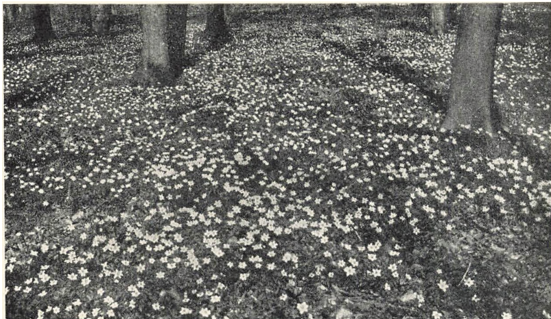
Jorden er dækket med hvide anemoner.