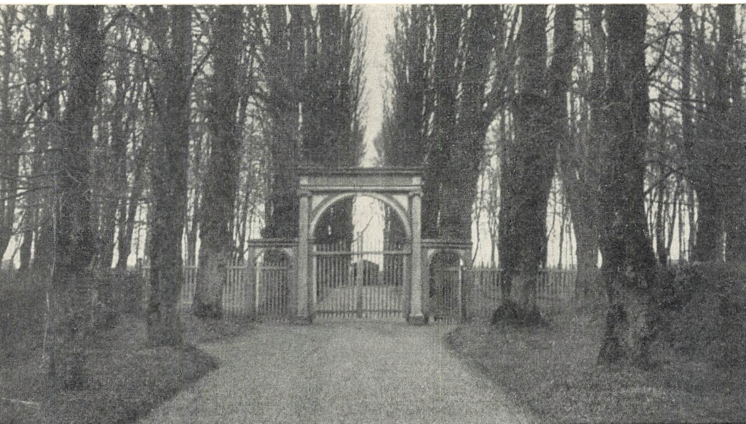
Lindealléer på brødremenighedens kirkegård i Christiansfeld

at læse for at stille blodet 128 ): Der står 3 liljer i min faders hellige Have. Den 1 heder Ikke blomster, den 2 heder Skrukke blomster, den 3 heder blodet skal stå stille. Og således skal blodet stå stille og være på sit bestemte sted.