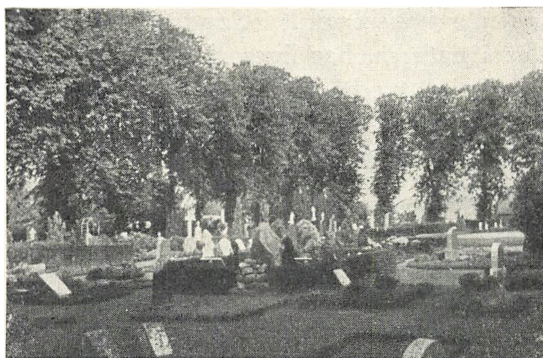
Lindetræer omkring Ulkebøl kirkegård

85. Lindetræet plantedes tidligere ofte mere end nu, og navnlig i middelalderen var det i stor yndest. Er også i vor tid anvendt som