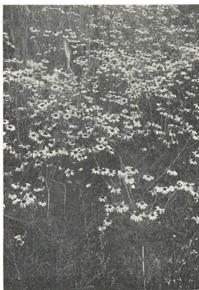
Blomstereng med kamilleblomster.

det skete på skrømt, og meningen var, at man skulle tro, at nu var turen kommen til kålen i haverne, — derfor måtte disse købes fri, ved at koen lod pigerne skænke op for karlene; skikken at »stryge for kål« har også været meget udbredt i landsdelen så vel som i kongeriget 107 108 ). Til hakning af k. brugtes et kåles, et s-formet knivsblad 108 ), — og een gang om året, nemlig til skærtorsdag, skulle man spise syv slags k. 109 ). — Når det ved en dans var småt med siddepladser ( Als ), kunne de siddende karle opfordre de stående til at sidde på deres knæ, hvilket kaldtes: på min kålgård 110 ). — K. brugtes også i dyrlægemedicinen. Kunne en ko ikke blive fri for efterbyrden, skulle man stiltiende plukke 3 kålblade i en anden mands kålgård og give koen dem 111 ). — Det hed sig, at i Sønderløgum var der kun een ærlig mand, og det var degnen, og han var kåltyv 112 ).