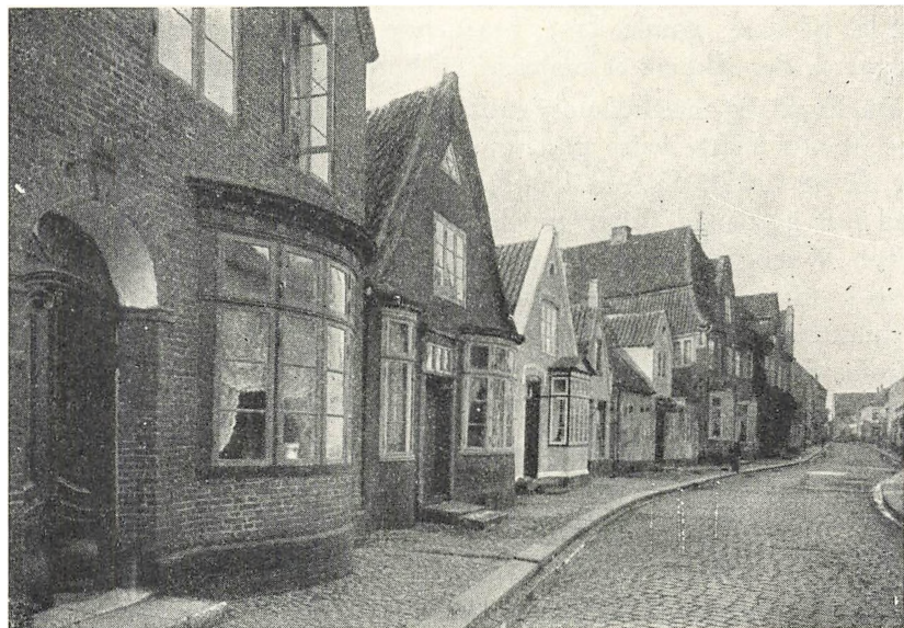
Østergade i Tønder