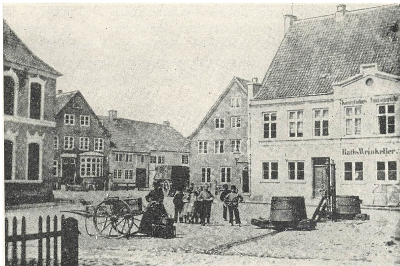
Tønder torv før århundredskiftet