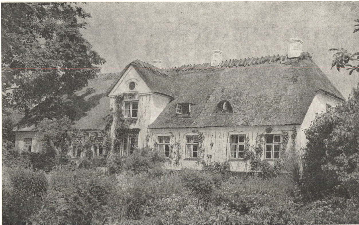
Asserballe Præstegaard. (»Det hvide Hus«).