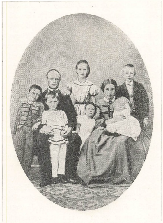
Familien Bang. (Længst tilvenste Herman Bang).

»Tine« blev Hovedpersoner i den ene af Herman Bangs Bøger om Asserballe.