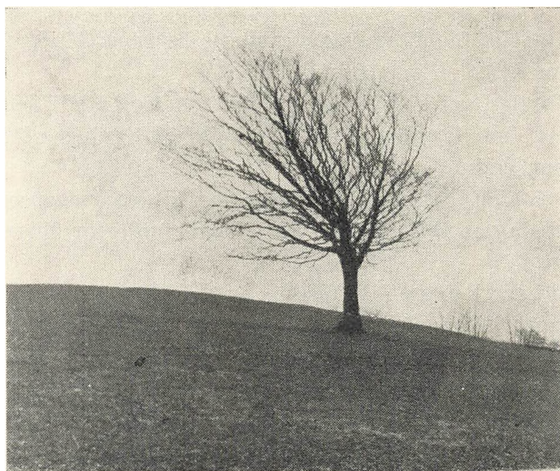
»Brandbøgen« i Lunden.