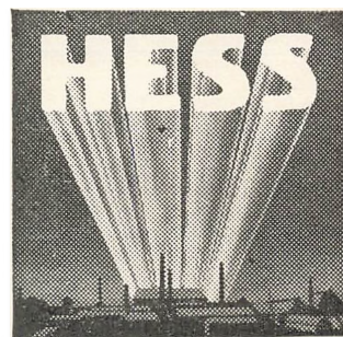
C. M. Hess' Fabrikker A/S