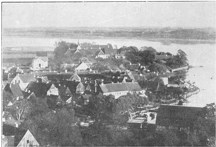
Holmen med St. Hans Kloster i Slesvig.

Holmen i Slesvig er noget helt for sig selv!