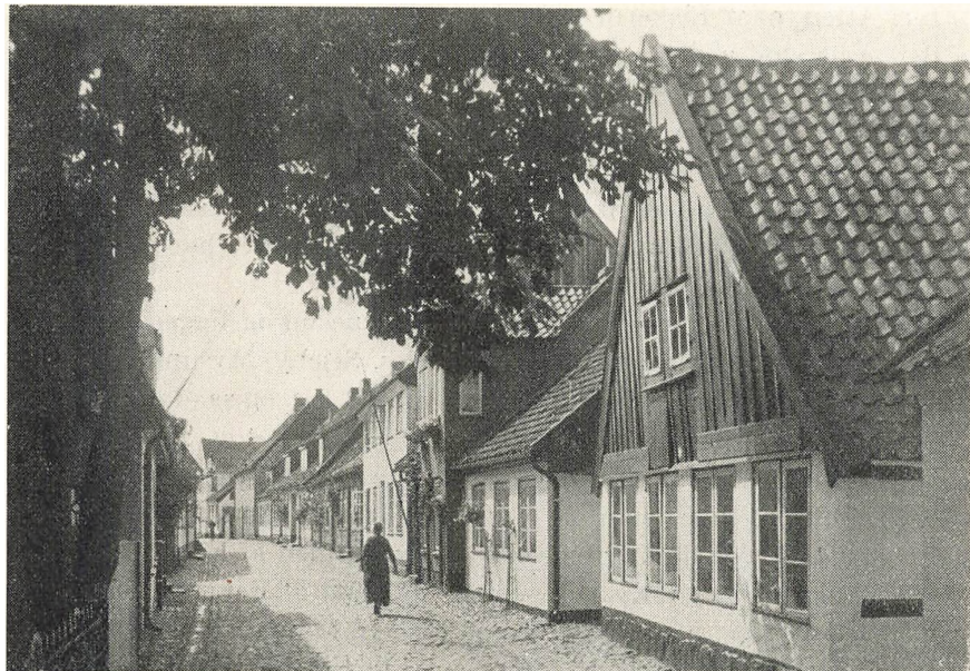
Parti fra Holmen i Slesvig.