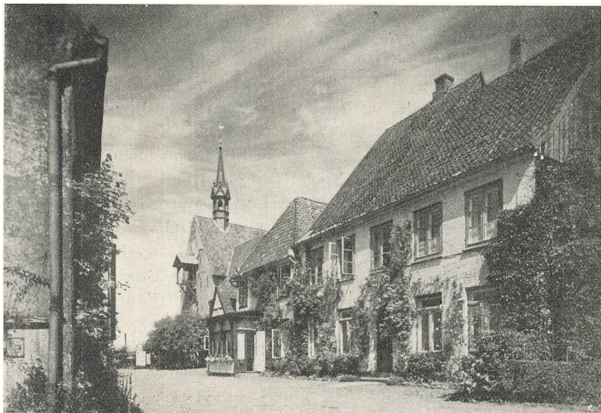
St. Hans-Klostret paa Holmen.